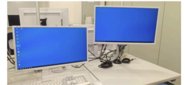
デスクトップPCスペース

※ 岩槻メディアプラザWebサイト では 各種マニュアル 、 Q&A および パソコンの便利な使い方 を掲載しています。併せてご利用ください。