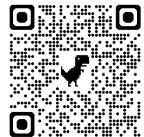
KYOCERA Net Manager